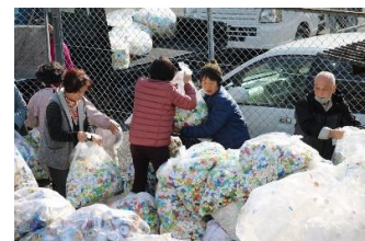
女性部によるペットボトルキャップ回収作業