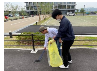
職員による清掃活動